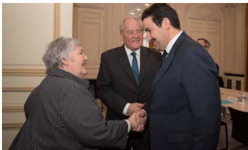
Audience avec Mme Jacqueline Gourault, ministre