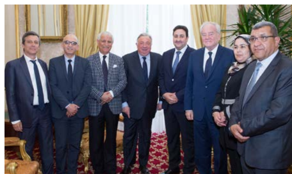
Audience avec M. Gérard Larcher, Président du Sénat

M. Gérard Larcher s'est également montré attentif au processus de décentralisation que le Maroc a initié au début des années 2000.