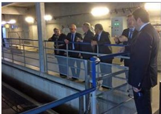
La délégation à l'usine de Choisy-Le Roi

Il s'agit de la plus grande usine d'eau potable du monde. Installée en bord de Seine depuis le 19 e siècle, et constamment modernisée depuis, elle est un modèle technologique, industriel et environnemental. Elle comprend actuellement 4 décanteurs, 53 filtres à sable, 12 filtres à charbon et 12 réacteurs UV.