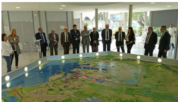
La délégation à Marseille-Fos

Premier port de France , Marseille-Fos est un port global dont les infrastructures permettent de traiter tous les types de trafic. Sa position géographique et sa quadri-modalité (train, route, fleuve et pipe-line ) en font la porte Sud de l'Europe . Le port de Marseille est constitué de deux bassins complémentaires ; le bassin Est (400 hectares) pour les marchandises et les passagers, situé à Marseille, et le bassin Ouest (11 000 hectares) pour les grands flux, situé à Fos-sur-Mer.