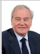
M. Christian Cambon

Président du groupe d'amitié France-Maroc - Sénateur du Val-de-Marne - (Les Républicains)